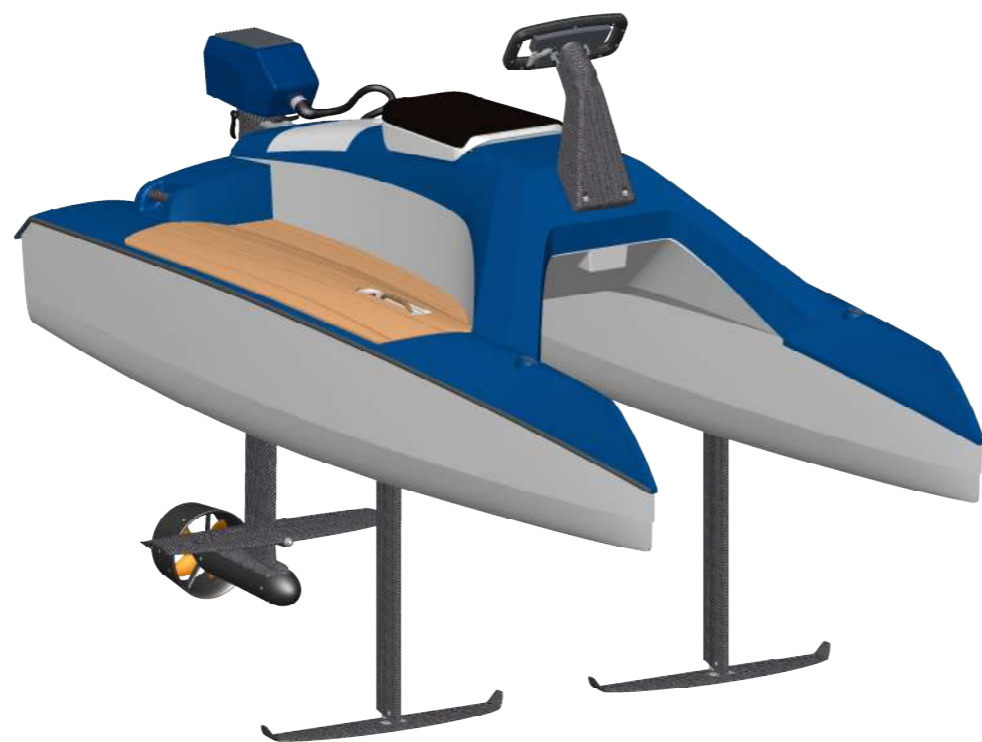
Overboat en position de navigation hydroptere