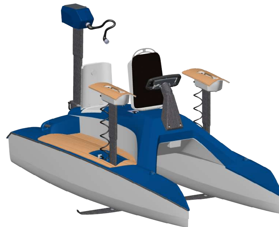
Overboat en position de navigation archimédien et capots ouverts